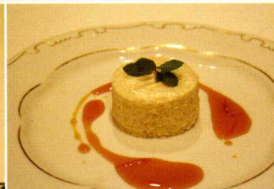
彩り豊かな料理の絵画