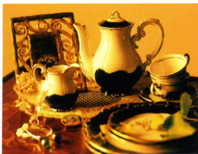
ハンガリーワインとクラフト、ZSOLNAY 磁器のショップ「AZ COLLECTION」も併設。