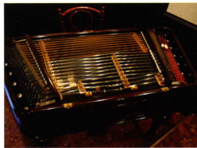
ハンガリー伝統の打弦楽器〈ツィンパロム〉、定期演奏会にご期待ください。